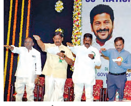
జాతీయ భద్రతా అవగాహన పై వాగ్దానం చేయిస్తున్న మంత్రి వివేక్, దానకిషోర్, మోహన్ బాబు తదితర శాశాధికారులు

పరిశ్రమలు 'జీరో యాక్సిడెంట్' గా మారాలి: మంత్రి వివేక్