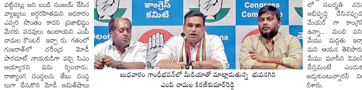
బుధవారం గాంధీభవన్లో మీడియాతో మాట్లాడుతున్న భువనగిరి ఎంపి చామల కిరణ్ కుమార్ రెడ్డి

భువనగిరి ఎంపి చామల కిరణ్ కుమార్ రెడ్డి హైదరాబాద్, మార్చి 4, ప్రభాతవార్త: ప్రధానమంత్రి నరేంద్రమోడీ, అమిత్ షాలు ఇప్పుడు బిల్లారంగా వ్యవహరిస్తున్నారని భ్రష్టుపెట్టారని భువనగిరి ఎంపి చామల కిరణ్ కుమార్ రెడ్డి ఆరోపించారు. గాంధీ భవన్లో విలేఖరుల బుధవారం మాట్లాడుతూ రాజకీయ ప్రధాని అవడం అంటే దేశానికి గ్రహణం పట్టినట్లు అని బండి సంజయ్ చేసిన వ్యాఖ్యలు అర్థవహితమని అధికారం ఎవ్వరి సొంతం కాదని ప్రకాశించి మేరకు పదవులు ఉంటాయని ఎంపి చామల కిరణ్ ఇచ్చారు. గతంలో గుజరాత్లో నరేంద్ర మోడీ పౌరహితే నాయకుడిగా వచ్చి సీఎం అయ్యారని విమర్శించారు. రాజ్యాంగ సంస్థలను జేబు సంస్థలుగా చేసుకొని మోడీ అమిత్ షాలు