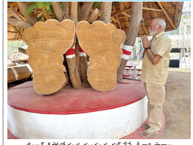
టింబర్ డిపోలో కలవ దుంగలను కట్ చేస్తే శ్రీవారి పాదాల నమూనా ప్రత్యక్షం కావడంతో వాటికి నమస్కరిస్తున్న డిపో యజమాని