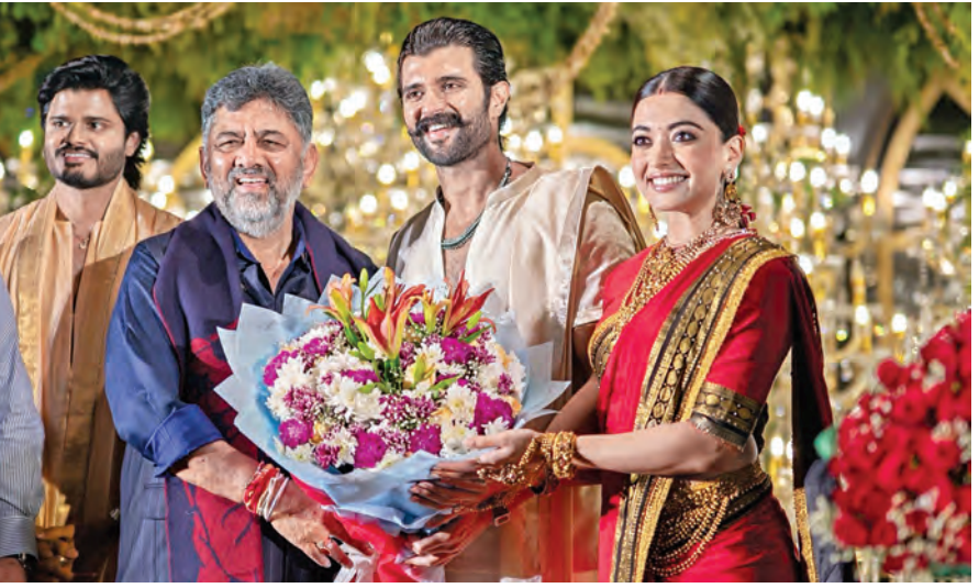
హైదరాబాద్ లో విజయ దేవరకొండ, రవీంద్ర వెద్దింగ్ రిసెప్షన్ కు హాజరైన కర్ణాటక డి.సి.ఎం డి కె శివకుమార్