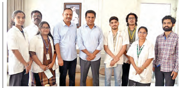
బుధవారం లక్ష్మారెడ్డి నివాసంలో బిఎల్ఆర్ చరిటబుల్ ట్రస్ట్ ఆధ్వర్యంలో 16 మంది ఎంటిబిఎన్ విద్యార్థులకు చెక్కలు అందజేసిన మాజీ మంత్రి కెటిఆర్

చేస్తున్న రాజకీయం మీది అంటూ నిందించారు. దేశ ఐక్యత కోసం కన్యాకుమారి నుండి శాశ్వత వరకు పాదయాత్ర చేసి దేశ ప్రజలకు ఐక్యతను చాటి మీ ప్రభుత్వానికి నిద్ర లేకుండా చేస్తున్న రాజకారాణం గాంధీ గారిని విమర్శించడం తగదని అన్నారు. ఆశాఠం మీద ఉమ్మడి మీ ముఖం మీదే పడుతుంది ఆ వాస్తవాన్ని బండి సంజయ్ తెలుసుకోవాలని కోరారు. రెండు సార్లు ఎంటిగా గెలిచి కేంద్ర మంత్రి అయితే తెలంగాణకు ప్రత్యేక నిధులు తీసుకురాని దృష్ట్యా బండి సంజయ్ మీ వ్యవహారాలపై మార్పుకోవాలని హితవు చెప్పారు.