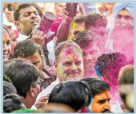
న్యూఢిల్లీలోని పార్టీ కార్యాలయంలో బుధవారం జరిగిన హోలీ వేడుకల్లో పాల్గొన్న రాహుల్ గాంధీ