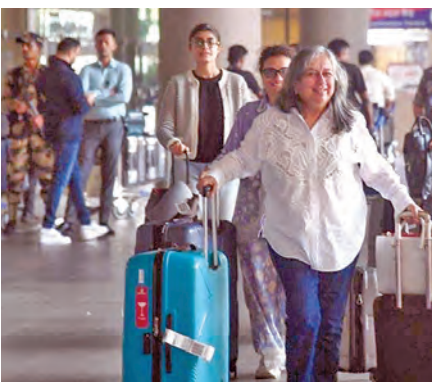
బుధవారం ఒక్కోకే 58 ప్రత్యేక విమానాలు నడుపుతున్నట్లు కేంద్ర పౌర విమానయాన మంత్రిత్వ శాఖ ప్రకటించింది. ఇండిగ్ 30 విమానాలను, ఎయిర్ ఇండియా, ఎయిర్ నాలు న్యూఢిల్లీ, ముంబై, బెంగళూరు, కొచ్చి, అహ్మదాబాద్, తిరువనంతపురం విమానాశ్రయాలకు చేరుకోవనున్నాయి. ప్రస్తుతం దుబాయ్ గగనతలం పాక్షికంగా మాత్రమే తెరిచి ఉంది.

నేపథ్యంలో విమానాలకు అనుమతి నిస్తున్నారు. ఈ నేపథ్యంలో విమానయాన సంస్థ నుంచి నిర్ధారిత బయలుదేరే సమయం గురించి సమాచారం అందిన తర్వాత విమానాశ్రయానికి రావాలని అధికారులు ప్రయోజితులకు స్పష్టమైన సూచనలు జారీ చేశారు. అప్పటివరకు దుబాయ్ అంతర్జాతీయ విమానాశ్రయం లేదా అల్ ముక్తమ్ అంతర్జాతీయ విమానాశ్రయానికి వెళ్లవద్దని కోరారు. మరోవైపు అబుదాబి నుంచి తమ కార్యకలాపాలను గురువారం (మార్చి 5వ తేదీ) మధ్యాహ్నం 2 గంటల వరకు నిలిపివేస్తున్నట్లు ఎతిహాద్ ఎయిర్వేస్ ప్రకటించింది. ప్రయోజితుల భద్రత తమకు అత్యంత ముఖ్యమని పౌర విమానయాన మంత్రిత్వ శాఖ స్పష్టం చేసింది. రిఫండేలు, రివేన్యూలొగ్, ఇతర సహాయక చర్యల విషయంలో ప్రయోజితులతో పాదరర్పణగా వ్యవహరించాలని అన్ని విమానయాన సంస్థలకు ఆదేశాలు జారీ చేసింది. ఈ క్షిప్త సమయంలో విమాన టికెట్ల ధరలు అదుపు తప్పకుండా నిరంతరం వర్తమాన్యిస్తున్నాయి. ప్రయోజితులపై అసహన భారం పడకుండా చూస్తామని మంత్రిత్వ శాఖ హామీ ఇచ్చింది.